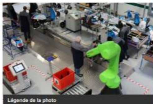
Légende de la photo